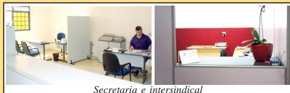
Secretaria e intersindical