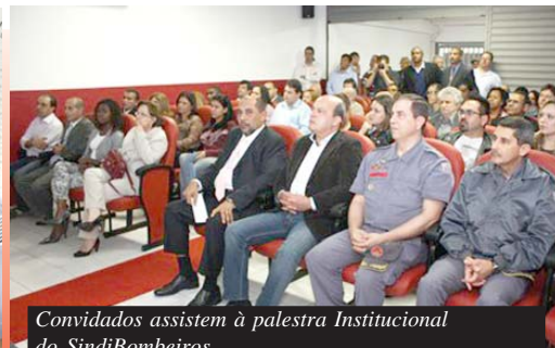
Convidados assistem à palestra Institucional do SindiBombeiros