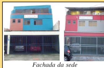
Fachada da sede