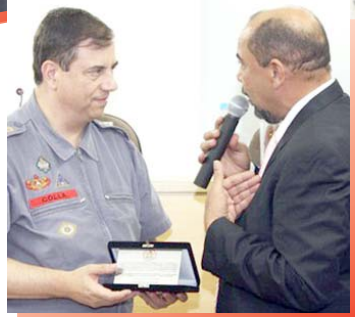
Placa em homenagem ao Corpo de Bombeiros da Polícia Militar do Estado de São Paulo