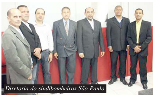
Diretoria do sindibombeiros São Paulo

Sede do Sindibombeiros totalmente repaginada