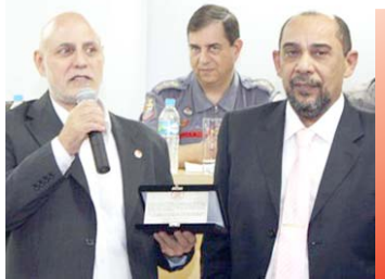
Placa em homenagem a UGT