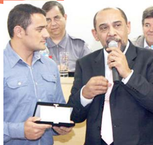
Placa em homenagem a Fenascon