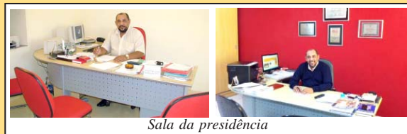
Sala da presidência