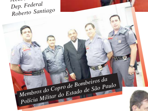
Membros do Copro de Bombeiros da Polícia Militar do Estado de São Paulo