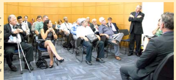
Em São Paulo, dia 27.02, aconteceu novo debate sobre Segurança Pública com a participação do Sindibombeiros

E no dia 27 de fevereiro, o Sindpd (Sindicato dos Trabalhadores em Processamento de Dados e Tecnologia da Informação de São Paulo) promoveu também em sua sede, na Capital, um debate sobre Segurança Pública e os desdobramentos da PEC 51. Representantes da diretoria do Sindibombeiros SP participaram do evento.