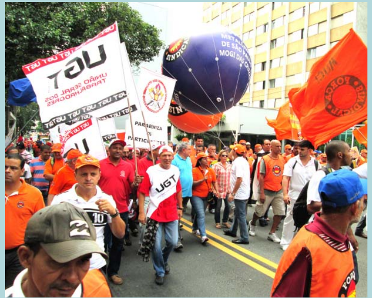
Sindibombeiros presente na Marcha para exigir o atendimento à agenda trabalhista

Cerca de 50 mil trabalhadores se reuniram no dia 9 de abril, em São Paulo, para participar da 8ª Marcha da Classe Trabalhadora, organizada pelas centrais sindicais. A concentração teve início na Praça da Sé, às 10 horas, e os manifestantes se dirigiram em seguida à Avenida Paulista, onde foi realizado um grande ato na altura do Vão Livre do Masp.