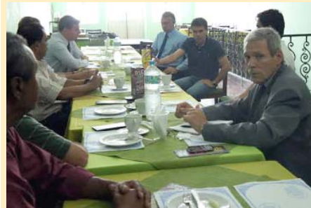
Debate sobre Segurança Pública realizado em Santos, dia 19 de fevereiro, com a participação do Sindibombeiros SP

aprovação da PEC 51. “Nosso país precisa de reformas urgentes, entre elas, a da segurança pública prevista na PEC 51. Os parlamentares devem apreciar e votar essas