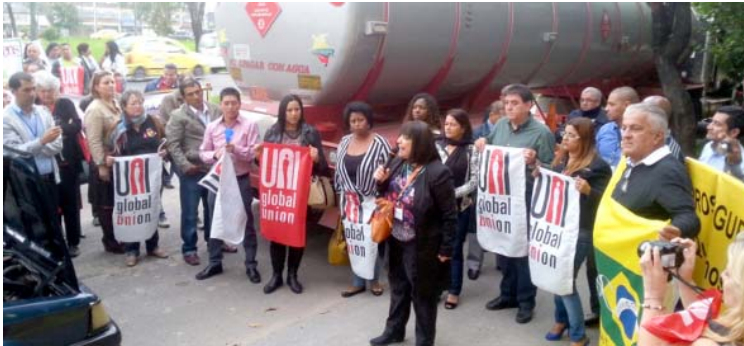
Sindicalistas de vários países protestam em frente à empresa Prosegur, em Bogotá, na Colômbia

O ato foi organizado pela UNI Global Union – entidade na qual o Sindibombeiros é filiado.