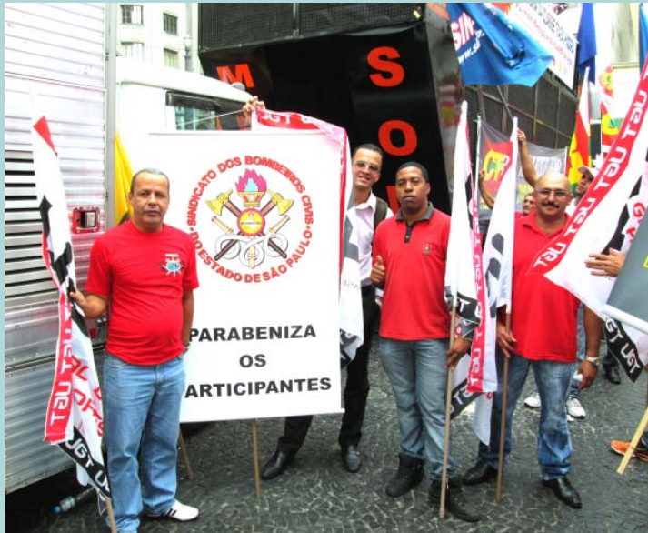
Representantes do Sindibombeiros participam da Marcha dos Trabalhadores