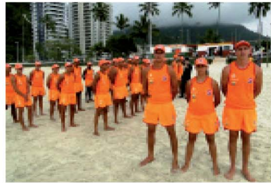
Treinamento de guarda-vidas garante homens e mulheres preparados para o trabalho de salvar vidas

Tanto para adultos como para jovens e crianças, é bom sempre ter em mente e praticar a velha orientação: “água no umbigo, sinal de perigo”.