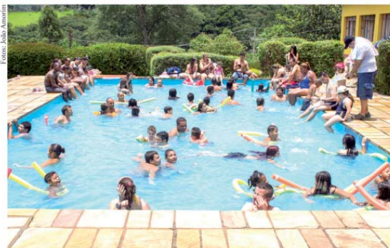
Calor forte e um banho de piscina para refrescar adultos e crianças na Chácara Aconchego