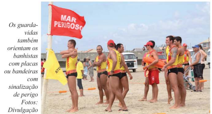
Os guarda-vidas também orientam os banhistas com placas ou bandeiras com sinalização de perigo