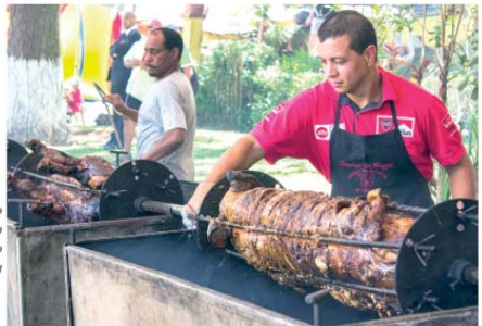
Novidade no cardápio: o saboroso leitão à pururuca