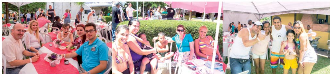
Famílias de bombeiros civis e salva-vidas prestigiam Festa do Sindicato