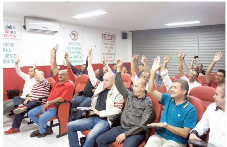
Categoria marcou presença na Assembleia Geral realizada em julho para dar início à Campanha Salarial