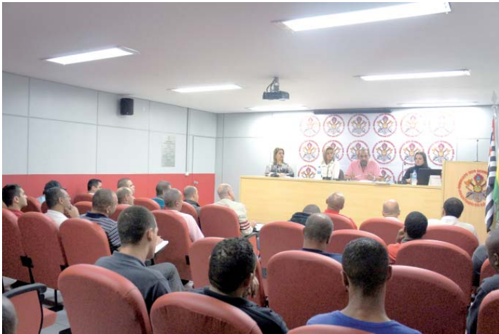
Assembleia dos bombeiros civis na sede do Sindicato, no dia 24 de julho, definiu a pauta de reivindicações da Campanha Salarial 2015/2016