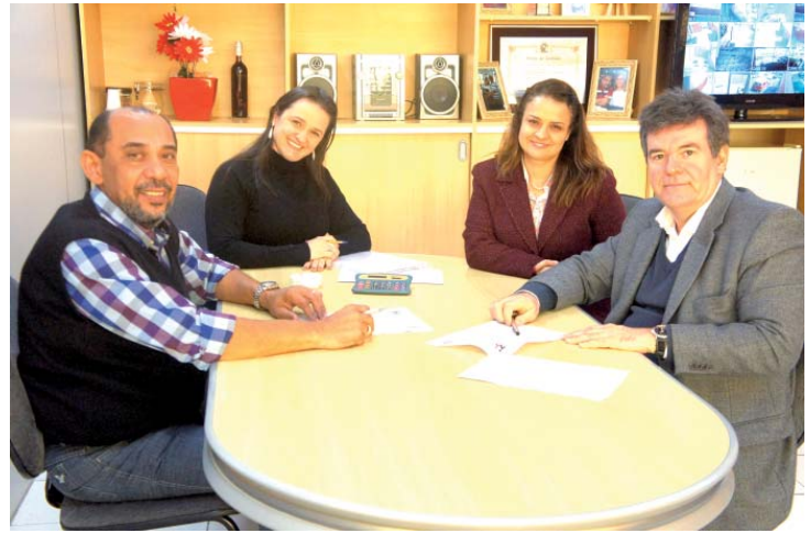
Após a rodada de negociações entre representantes do Sindibombeiros e do Sindicato Patronal, Campanha Salarial é encerrada com resultados positivos para a categoria

A situação econômica do Brasil é crítica e o governo federal busca a todo instante implantar ajustes, promover cortes de benefícios trabalhistas, com decisões antipopulares como a da Medida Provisória 680 que criou o Programa de Proteção ao Emprego (PPE), reduzindo salários e carga horária em cerca de 30%.